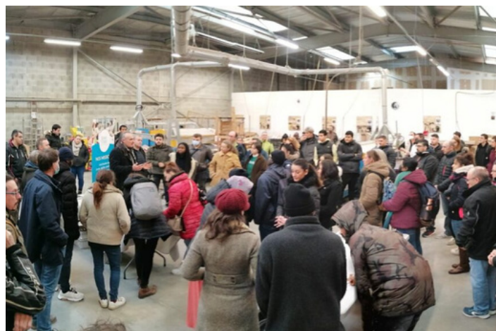
CIRCUIT DES MÉTIERS DU PEURAS - 2022

La vocation de cet évènement est de présenter à un public demandeur d'emploi les métiers des entreprises présentes. S'il ne s'agit pas d'une opération de recrutement à proprement parler, les participants auront toutefois la possibilité de laisser un CV à l'issue de la visite. Huit circuits de visite seront proposés tout au long de l'après-midi.