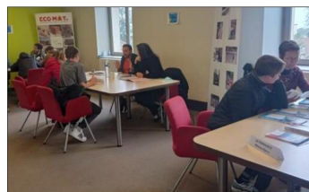
Des entretiens individualisés ont été proposés pour permettre un échange entre entreprises et demandeurs.

vous a intéressé de nombreux parents qui, d'ordinaire, doivent s'orienter sur des forums d'orientation à Grenoble ou à Lyon. De plus, un vivier d'entreprises locales est en capacité de proposer des stages, des formations ou des alternances. Ces rencontres individualisées ont permis des échanges enrichissants. Des offres d'emploi étaient également affi-