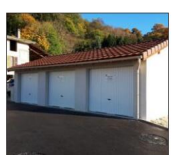
Les garages sont terminés et occupés.

Les trois garages municipaux du clos de Sanissard ont trouvé locataires depuis début décembre. Par ordre d'arrivée, les différentes demandes ont été traitées par la municipalité. Trois familles voureyssiennes ont pu ainsi bénéficier d'un garage pour ranger leurs véhicules. Cette opération a été cofinancée par la municipalité et le Pays voironnais au titre du fond de concours aux petites communes. La CAPV a accordé une enveloppe de 11 462 euros, soit 42 % du montant des travaux pour la construction des garages. À ce jour il reste à la mairie à vendre un terrain constructible de 645 m 2 et une maison avec de grosses rénovations pour que cette OAP soit terminée.