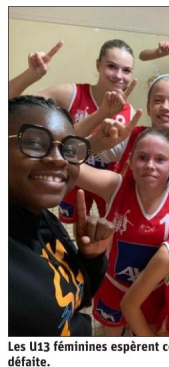
Les U13 féminines espèrent continuer leur parcours sans défaite.