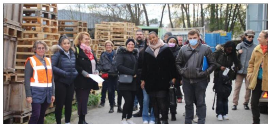
Un des groupes est prêt à rejoindre l'entreprise Smoc.

La Ville de Tullins, en partenariat la Maison de l'emploi et de la formation des Pays voironnais et Sud Grésivaudan, ainsi que Passiflore, a organisé un circuit de découverte des entreprises situées sur la zone du Peuras de la commune tullinoise. Pour cette première à Tullins, ce jeudi 8 décembre, Passiflore a accueilli plus de 80 personnes en recherche d'emploi, qui se sont présentées pour participer à cette opération portes ouvertes. En présence du maire Gérald Cantournet, sept circuits comprenant deux visites d'entreprises différentes ont été proposés