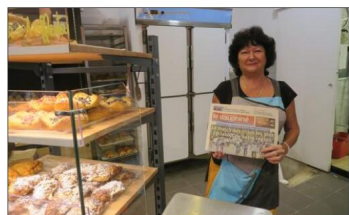
Au Palais gourmand vend Le Dauphiné Libéré le dimanche à compter de ce 16 octobre.

Depuis ce 16 octobre, la boulangerie-pâtisserie Au Palais gourmand, au 14 rue Adolphe-Péronnet à Voiron, met en vente votre quotidien Le Dauphiné Libéré, tous les dimanches. Le reste de la semaine, le tabac-presse Le Village, au 11 de la même rue, continue à diffuser votre journal.