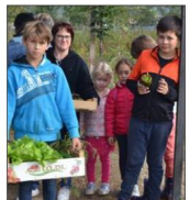
Les enfants ont passé un bon moment.

Ainsi, la maraîchère de Crossey-cueillette accueillait les ramasseurs qui ont débambulé dans les champs où les serres à la recherche des légumes de sai-