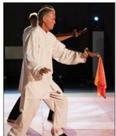
Une démonstration de tai chi.

La première partie de la soirée s'est terminée par la prestation époustouflante