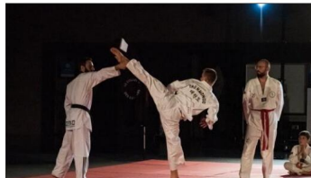
Les karatékas ont démontré au public la casse de planche.

par une véritable démonstration de Lai Muoi, par le club du même nom. Il s'agissait de nombreuses casses de planches ou de