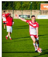
Le SOV ira jouer face à Saint-Priest ce dimanche à 15 h.