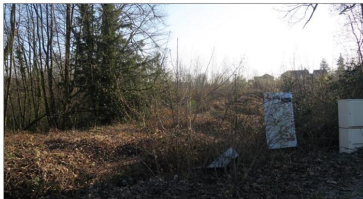
Près du château de Beegue, c'est à cet endroit qu'un défrichage, qui a été signalé au procureur, a été réalisé pour créer l'accès au futur projet.

Alors qu'ils ont pu consulter le permis de construire déposé en mairie, et accessible au public, les riverains se sont interrogés enco-