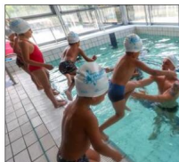
Des créneaux sont proposés gratuitement pendant les vacances de Pâques.

Dans le cadre du plan national de lutte contre les noyades, en partenariat avec la Ville de Voiron, l'Agence nationale du sport, et le Ministère chargé des Sports, deux stages bleus aïssance aquatique se dérouleront à la piscine de Voiron durant les congés de printemps, à destination des petits Voironnais de 4 à 6 ans. Ces stages sont 100 % gratuits pour les familles. Trois créneaux de quatre séances par jour sur quatre jours sont proposés à destination des petits Voironnais. Ces créneaux se dérouleront du 19 au 22 avril et du 25 au 29 avril (sauf le mercredi 27) : de 9 h 30 à 10 h 10 et de 13 h 30 à 14 h 10 : inscription libre des familles ; de 10 h 30 à 11 h 10 et de 14 h 30 à 15 h 10 pour les enfants du Centre Nature et Loisirs (transport pris en charge par le dispositif) ; de 11 h 30 à 12 h 10 et de 15 h 30 à 16 h 10 : inscription libre des familles.