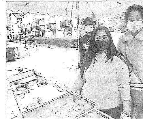
Sur le marché, un nouveau stand proposait des produits aux saveurs malgaches.

Avec l'envie de voyages, de sorties, de découvertes exacerbés en raison de la crise sanitaire, la curiosité aussitôt répondu présente sur le marché samedi. Il s'agissait de préparations typiques malgaches assimilées aux préparations créoles, confites 5 h du matin, et proposées à la vente aux marchés ont véritablement dévalisé le stand !